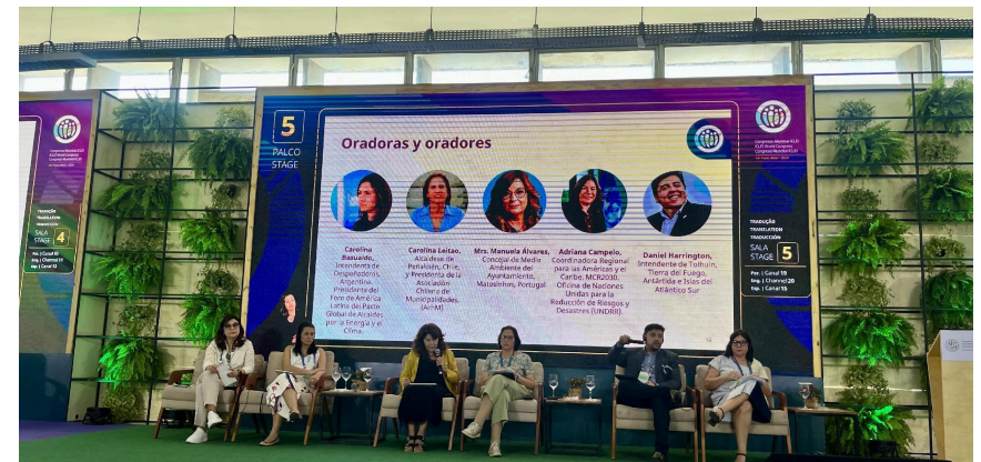
Imagen del Panel del Diálogo Hemisférico Urbano 2024