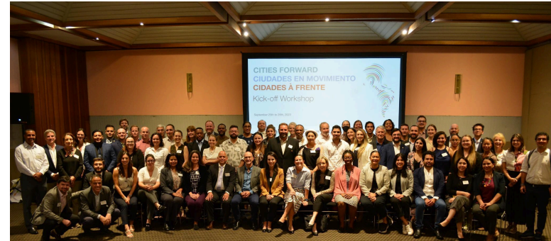
Picture of Cities Forward participant cities' representatives at the program kick off in Mexico City, Mexico

La información de la guía fue recopilada de documentos, sitios web e informes de acceso público. Posteriormente, todas las instituciones multilaterales y algunas agencias de EE. UU. incluidas en la guía fueron contactadas para obtener comentarios sobre su sección. La guía, en primer lugar, resume información fundamental sobre las principales fuentes de financiamiento verde para los participantes de Cities Forward en un formato de tabla, seguida de información más detallada en los anexos.