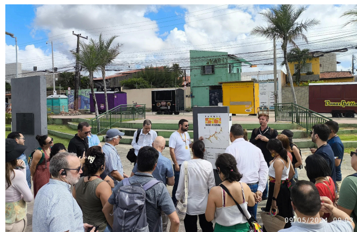
Foto de los representantes de las ciudades participantes en el programa Cities Forward visitando el sitio del proyecto agrícola en Mérida.

Apoya proyectos liderados por el gobierno nacional, los estados, los municipios y organizaciones de terceros dirigidos a prevenir, monitorear y combatir la deforestación, así como para la conservación y el uso sostenible del bioma amazónico. Financia varios proyectos, incluyendo gestión forestal pública, control ambiental, silvicultura sostenible y actividades que utilizan el bosque de manera sostenible, financiados a través de donaciones y rendimientos de inversiones.