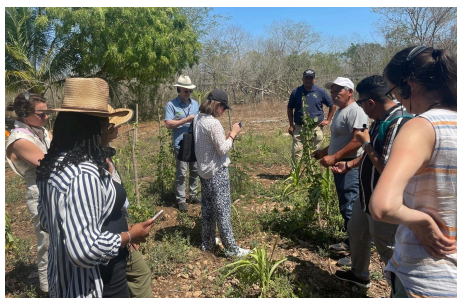
Foto de los representantes de las ciudades participantes en el programa Cities Forward en Fortaleza, Brasil, en el Parque Rachel de Queiroz

El Fondo Especial de Cambio Climático es gestionado por el GEF; otorga préstamos para adaptación; los países en desarrollo son los principales clientes; se hace énfasis en la participación del sector privado; y las ISDs son un enfoque especial. El GEF-8 (título del ciclo de financiamiento) se enfoca en agricultura, agua, sistemas de alerta temprana, soluciones basadas en la naturaleza, etc. Proyecto aprobado en 2022: "Pilotaje de financiamiento innovador para tecnologías de adaptación al cambio climático en ciudades medianas."