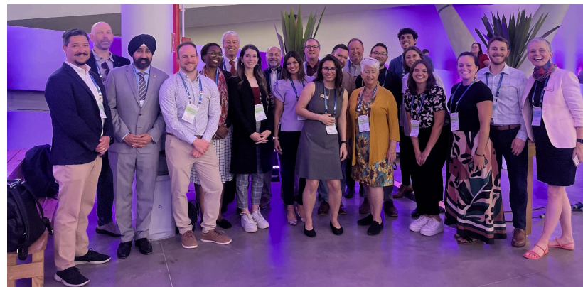
Foto de los asistentes al Congreso Mundial de ICLEI 2024 en Sao Paulo, Brasil.

El GPSC es una plataforma de asociación y conocimiento que tiene como objetivo promover soluciones integradas y nuevas tecnologías para mejorar la sostenibilidad y la resiliencia urbana. Opera en 28 ciudades de 11 países.