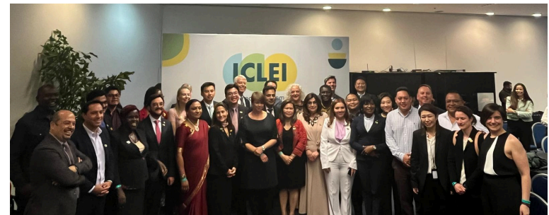
Picture of The Hemispheric Dialogue on Climate Resilience & Adaptation, a precursor to the ICLEI World Congress 2024, played a pivotal role in the Cities Forward program